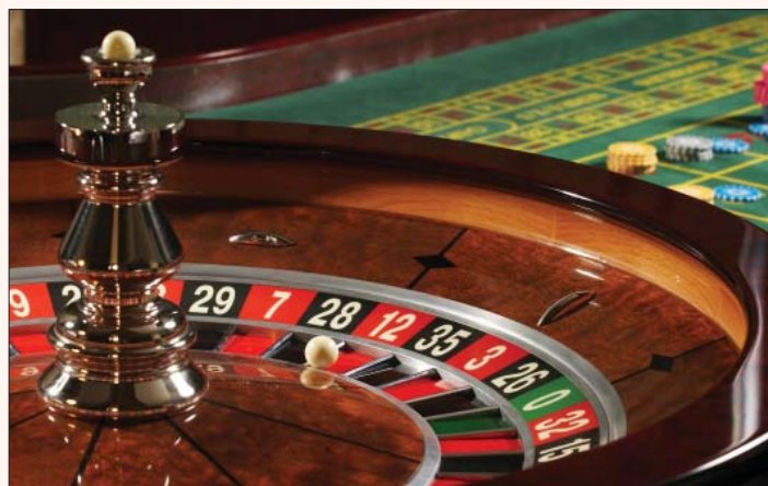
Возможно, Ленинградская область станет еще одной игровой зоной в стране

Из Тихвина повезут торф в Германию, хвою – во Францию. А в Тихвине применяют немецкие технологии по утилизации мусора и очистке воды. Соответствующие деловые договоренности были достигнуты 27 октября во время проведения международных ганзейских дней бизнеса в Тихвине.