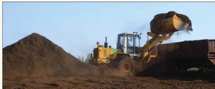
Немецкие партнеры по Ганзейскому союзу заинтересовались переработкой торфа

Из Тихвина повезут торф в Германию, хвою – во Францию. А в Тихвине применяют немецкие технологии по утилизации мусора и очистке воды. Соответствующие деловые договоренности были достигнуты 27 октября во время проведения международных ганзейских дней бизнеса в Тихвине.